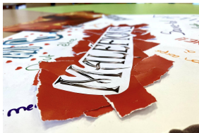
Collages réalisés par les élèves du collège de Chateauvillain (52)

Idée atelier L'intervention peut être doublée, une semaine à un mois plus tard, d'un atelier de collage animée par l'intervenante (matériel fourni). L'occasion pour les élèves, seuls ou en petit groupe, de restituer ce qu'ils ont retenu ou jugé le plus important sur la question des violences sexistes et sexuelles. Les créations peuvent faire l'objet d'une exposition au sein de l'établissement, à destination de tous les autres élèves.